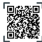
MONTÁŽNÍ VIDEO pro vozíky SOLID PRO